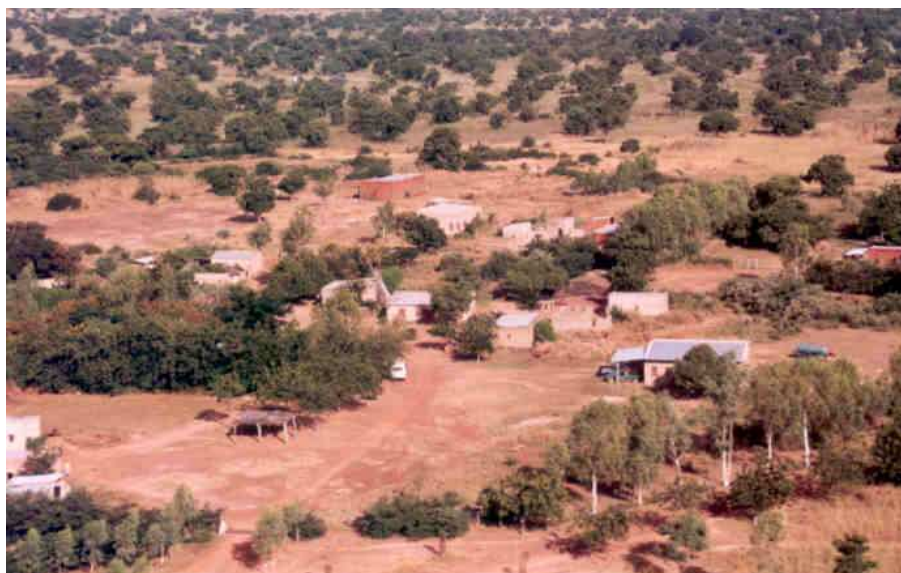
Vue aérienne du siège de l'AZN à Guiè (octobre 2003)

Association n° 95 – 021 / MAT / POTG / AG (Parution au Journal Officiel du 11 avril 96)