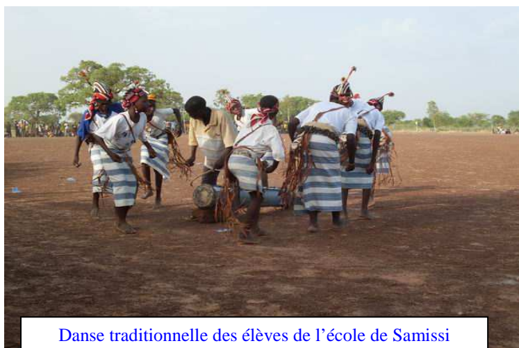
Danse traditionnelle des élèves de l'école de Samissi

Le parrainage scolaire dans sa lutte pour l'éveil des élèves a participé à la bonne marche des activités sportives et culturelles, annuellement organisées dans les différentes Circonscriptions d'Éducation de Base (CEB). Le but de ce festival culturel et sportif est de permettre aux enfants de se connaître davantage et favoriser leur éveil. Le CIER appuie les CEB de Dapélogo, Toéghin et Ourgou-Manéga en octroyant du riz pour la restauration des enfants durant les