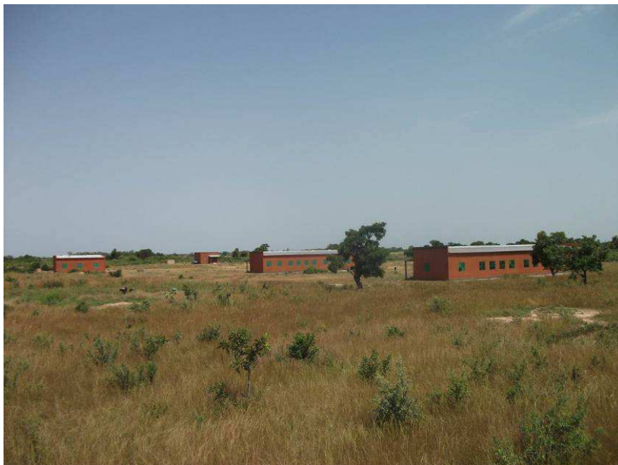
Vue d'ensemble du collège

Deux autres ont été recrutés par le collège pour dispenser les cours de Français et d'Anglais.